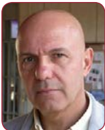
Dr. Antonio Cabrera de León Hospital Universitario Nuestra Señora de Candelaria (Santa Cruz de Tenerife)