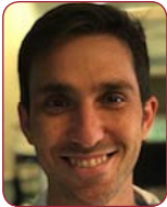
Dr. Amalio Ruiz Salas Hospital Universitario Virgen de la Victoria (Málaga)