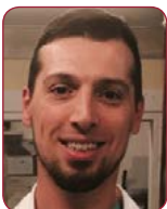
Dr. Paolo Domenico Dallaglio Hospital Universitari de Bellvitge (Barcelona)