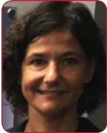
Dra. Patricia Palau Sampio Hospital General Universitari de Castelló