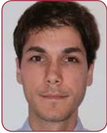
Dr. Carlos Ferrera Durán Hospital Clínico San Carlos (Madrid)