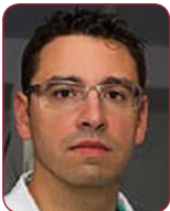
Dr. Isaac Pascual Calleja Hospital Universitario Central de Asturias